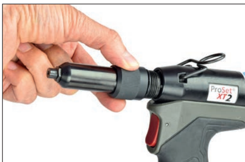
Szybkie odłączanie obudowy głowicy przedniej i szczęk (bez użycia narzędzi)