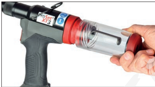
Szybko odłączany układ kolektora trzpieni (MCS)

Rodzina narzędzi POP Avdel ProSet® XT oferuje wiele innowacyjnych funkcji zwiększających wydajność, jak szybko odłączana obudowa głowicy przedniej i obudowa szczęk, co pozwala na szybkie czyszczenie i konserwację końcówek bez potrzeby użycia żadnych narzędzi. Szybko odłączany układ kolektora trzpieni (MCS) bezpiecznie gromadzi zużyte trzpienie, pozwalając na ich szybką i łatwą utylizację oraz lepsze utrzymanie porządku w miejscu pracy. Przełącznik odcinania powietrza w MCS blokuje przepływ powietrza, gdy MCS jest odłączony. Obrotowe obustronne złącze pneumatyczne obracane o 90° pozwala dostosować narzędzie do praktycznie dowolnej konfiguracji stanowiska roboczego, a włącznik minimalizuje zużycie powietrza i hałas.